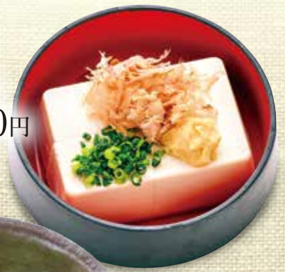
おつまみの定番! 冷奴 270円