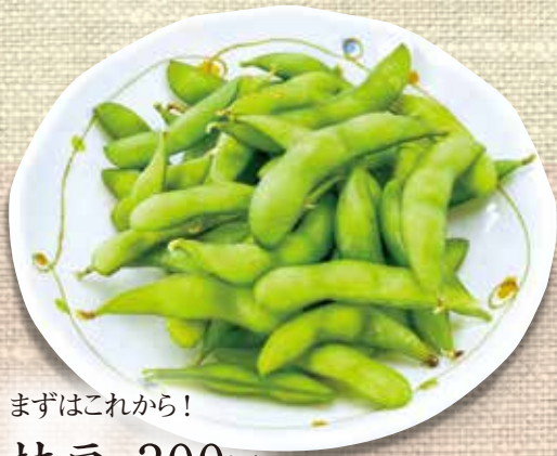
まずはこれから! 枝豆 300円