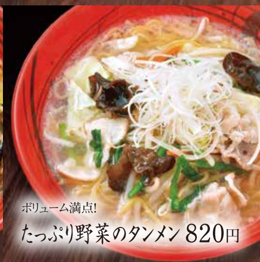
ボリューム満点! たっぷり野菜のタンメン 820円