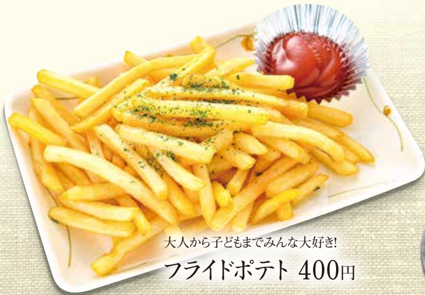
大人から子どもまでみんな大好き! フライドポテト 400円