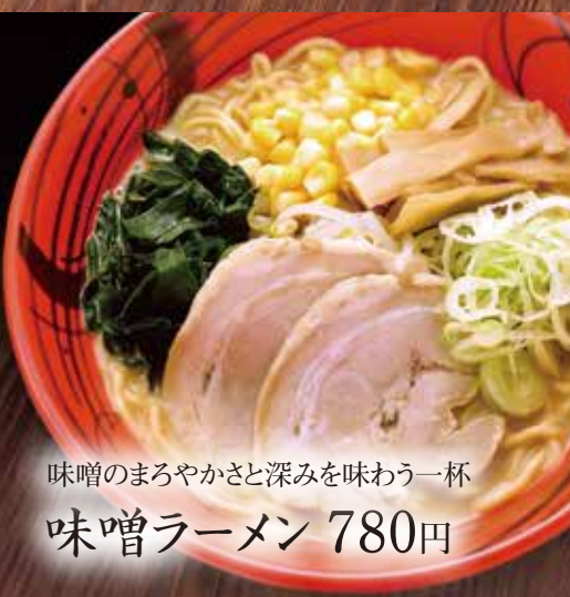
味噌のまろやかさと深みを味わう一杯 味噌ラーメン 780円