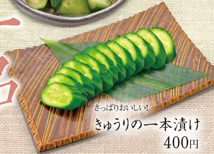
さっぱりおいしい! きゅうりの一本漬け 400円