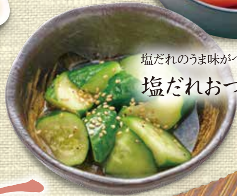
塩だれのうま味がベストマッチ! 塩だれおつまみきゅうり 300円