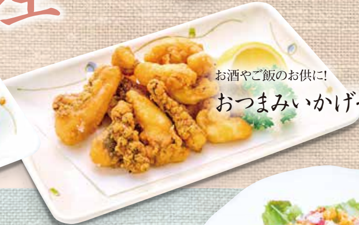
お酒やご飯のお供に! おつまみいかげそ唐揚げ 580円