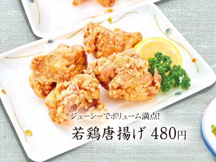
ジューシーでボリューム満点! 若鶏唐揚げ 480円