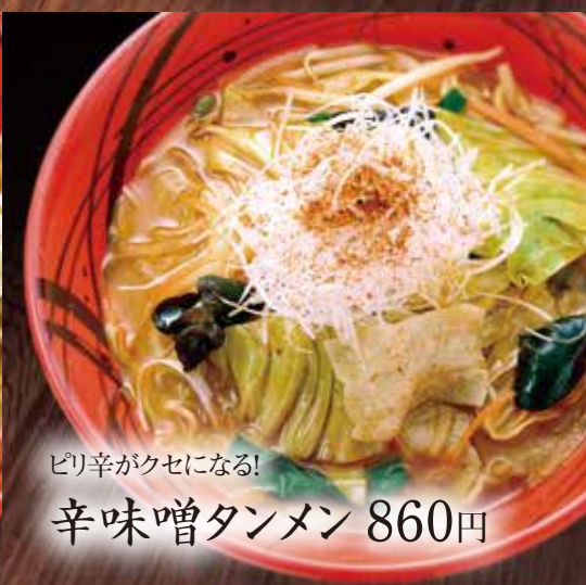
ピリ辛がクセになる! 辛味噌タンメン 860円