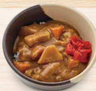
ミニカレーライス