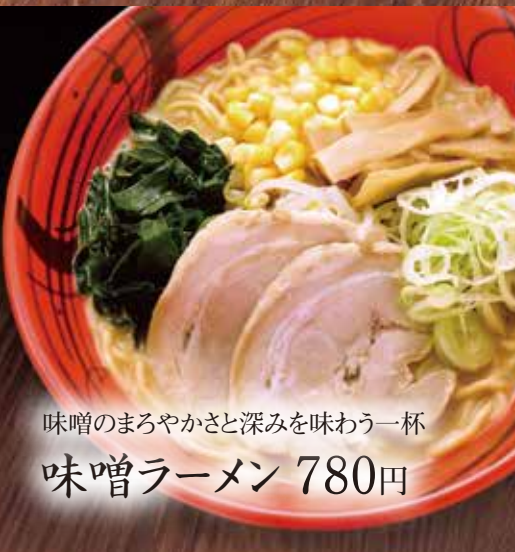
味噌のまろやかさと深みを味わう一杯 味噌ラーメン 780円