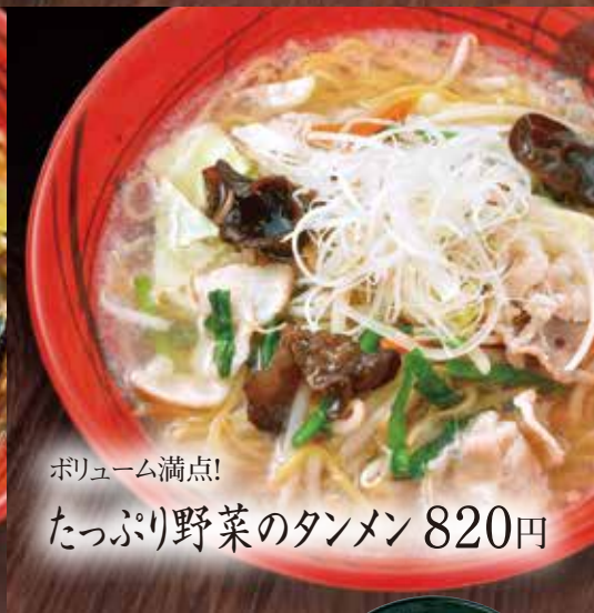
ボリューム満点! たっぷり野菜のタンメン 820円