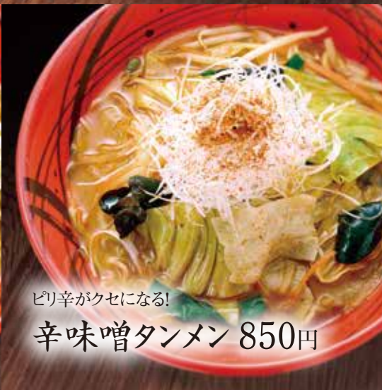
ピリ辛がクセになる! 辛味噌タンメン 850円