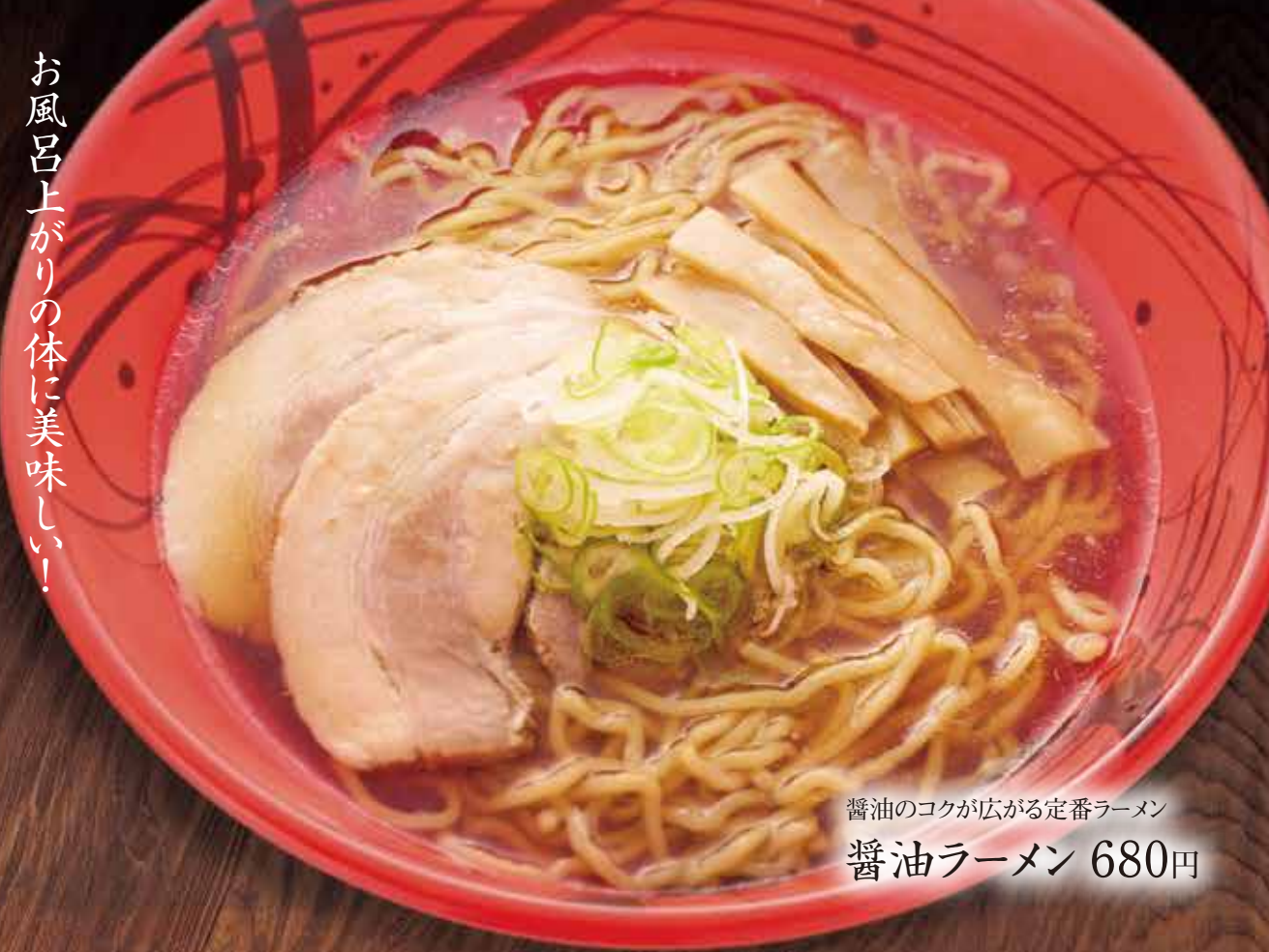
醤油のコクが広がる定番ラーメン 醤油ラーメン 680円